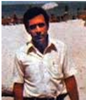
Antonio Villas Boas

Dogodilo se da se nisu nastavila događati samo viđenja NLO-a, već su se pojavila svjedočanstva da se u baš te objekte koje ljudi viđaju, neki ljudi i odvođe i svašta im se radi!